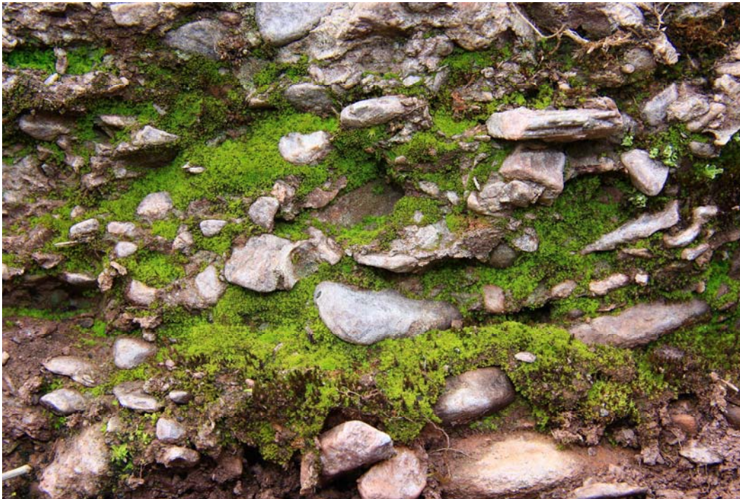
Abb. 3: Gymnostomum viridulum an einer beschatteten Felswand des Waderner Konglomerats am Sponsheimer Berg.

Schattenmoose stehen meistens bei weniger als 5% relativer Beleuchtungsstärke. Die Felstrockenrasen beherbergen zwei Schattenmoose. Die eine Spezies ist der submediterrane Gymnostomum viridulum , der ziemlich häufig in Nischen von Felsen siedelt (Abb. 3). Dabei handelt es sich überwiegend um Felsen, die beim Wegebau angeschnitten wurden. Die zweite Schattenpflanze im Gebiet ist Fissidens dubius . Sie kann grundsätzlich zwar keinem bestimmten Lichtwert zugeordnet werden, im Untersuchungsgebiet steht diese Art aber meistens am Grunde dichter Vegetation und wird deshalb zu den Schattenpflanzen gerechnet.