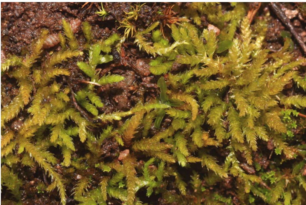
Abb. 4: Eurhynchium pulchellum auf einem beschatteten Felsen am Sponsheimer Berg.

Wie bereits besprochen, schlägt sich die Differenzierung der Arten in Licht- und Halbschattenmoose eindeutig in der Lichtzahl nieder. Auch bei den Temperatur- und Feuchtezahlen sind deutliche Unterschiede zu sehen. Während die Lichtmoose insgesamt als Mäßigwärmezeiger eingestuft werden müssen, fallen die Halbschattenmoose bereits in die Kategorie Kühlezeiger. Lichtmoose können entsprechend ihres Standorts als Trockenzeiger angesprochen werden, während Halbschattenmoose Frischezeiger sind.