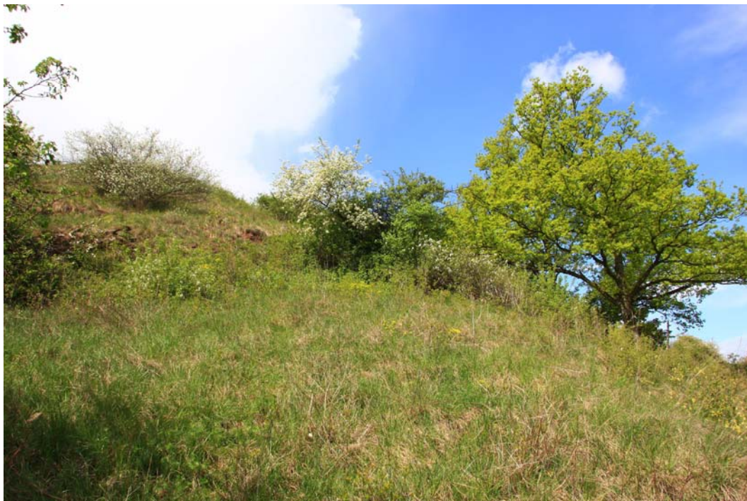
Abb. 2: Blick in einen Felstrockenrasen am Sponsheimer Berg bei Laubenheim/Nahe.

Die Bestimmung der Moose erfolgte nach FRAHM & FREY (2004) sowie NEBEL & PHILIPPI (2000, 2001). Die Nomenklatur richtete sich nach KOPERSKI, SAUER, BRAUN & GRADSTEIN (2000). Für die Angabe der Gefährdungsgrade von Rote-Liste-Arten wurde LUDWIG et al. (1996) herangezogen..