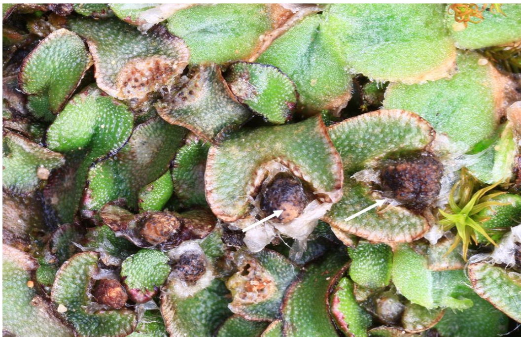
Abb. 5: Bei Mannia fragrans entwickelten sich im Jahre 2011 im unteren Nahetal die Archegonienständer wohl aufgrund extremer Trockenheit nicht (Pfeile). Aufnahme vom 24. Juni 2011.

Von den Arten der Trockenrasen am Sponsheimer Berg sind nach LUDWIG et al. (1996) sechs der sonnenexponierten und vier der beschatteten Standorte gefährdet. Es sind hervorzuheben: Eurhynchium pulchellum , Gymnostomum viridulum und Mannia fragrans . Von ihnen ist G. viridulum in nahezu sämtlichen Felsnischen zu finden und dürfte im Untersuchungsgebiet ungefährdet sein. E. pulchellum siedelt dagegen nur in einem kleinen Rasen auf einem exponierten, abbruchgefährdeten Felsabsatz des instabilen Rotliegend-Konglomerates (Abb. 4). Der Standort von M. fragrans befindet auf einer flachgründigen Felsplatte und unterscheidet sich praktisch nicht von anderen Vorkommen dieser Art im unteren Nahetal (OESAU 2010). Im Frühjahr und Sommer 2011 fiel bei dieser Art auf, dass die im vorangegangenen Winter entwickelten Archegonien nicht durch einen Stiel emporgehoben wurden, sondern in den umgeschlagenen Spitzenanhängseln der Bauchschuppen stecken blieben (Abb. 5). Die Ursache ist nicht bekannt. Da die Entwicklung der Archegonienständer in eine extrem lange Trockenperiode fiel, wird angenommen, dass der Anlass in fehlender Feuchtigkeit zu suchen ist.