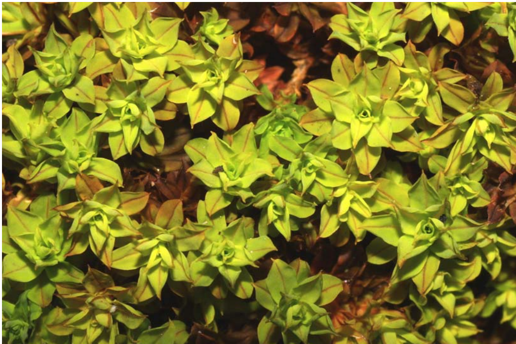
Abb. 4: Tortula crinita var. calva im Felstrockenrasen des Rotenbergs bei Fürfeld.

Etwa ein Drittel der Arten (35%) stammt aus submediterranen Arealen. Hierzu zählen vor allem die bereits angesprochenen Schistidium - und Tortula - Arten. In Deutschland konzentrieren sich die Fundorte submediterraner Schistidium -Arten einschließlich Tortula papillosissima var. submamillosa . vor allem im Saar-Nahe-Bergland (MEINUNGER & SCHRÖDER 2007). Einen Schwerpunkt ihrer Verbreitung in Rheinland-Pfalz hat auch Tortula crinita var. calva , die auf dem Rotenberg in großen Polstern Trockenrasen und Felsen überzieht (Abb. 4). Boreale bzw. subboreale Arten treten nur sehr selten auf ( Bryum elegans , Rhytidium rugosum ), ansonsten sind neben den mitteleuropäischen temperaten Arten keine weiteren Arealtypen vorhanden. Auch Lebermoose fehlen vollständig. Bemerkenswert ist ein reiches Vorkommen von Leucodon sciuroides auf einem alten Rebstock. Diese Art wurde im nördlichen Oberrheintal bisher nur einmal auf einer Weinrebe gefunden (OESAU 2004). Der Anteil von 13 Rote-Liste-Arten (42%) am Gesamt-Artenbestand ist ungewöhnlich hoch und unterstreicht die Bedeutung des Gebietes für die Erhaltung seltener und gefährdeter submediterraner Moose.