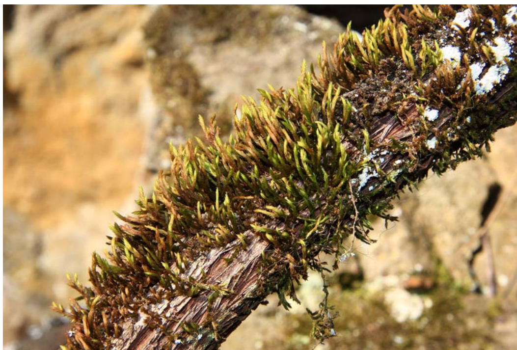
Abb. 4: Leucodon sciuroides auf einem alten Rebstock ( Vitis vinifera ) im Untersuchungsgebiet.