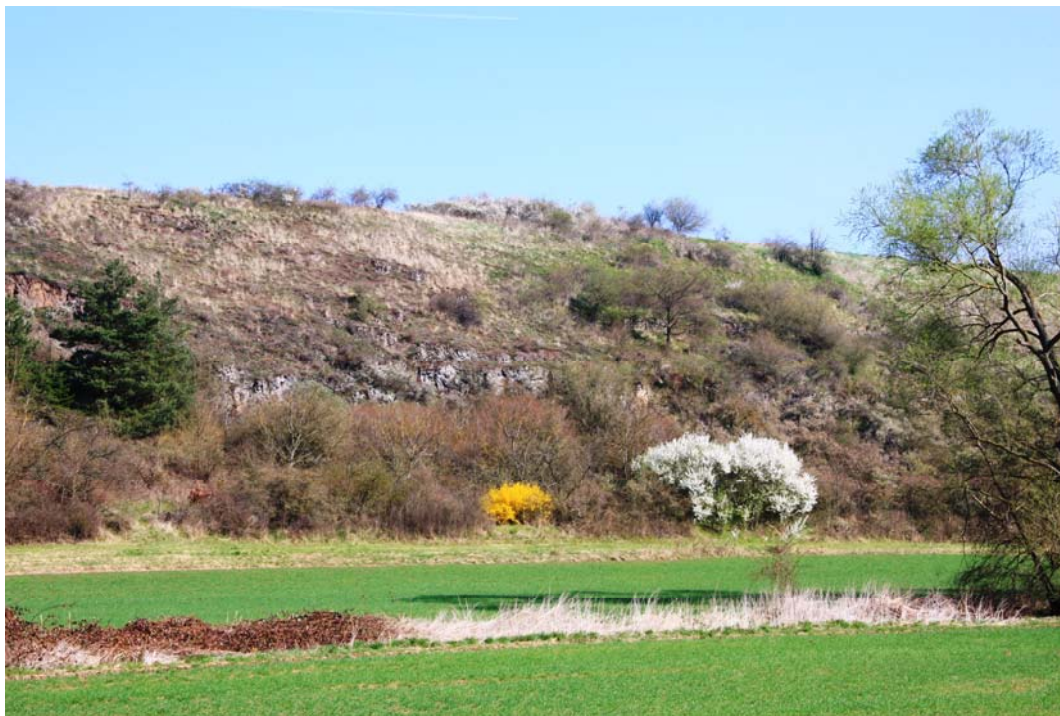
Abb. 2: Blick auf den Felstrockenrasen am Rotenberg östlich Fürfeld