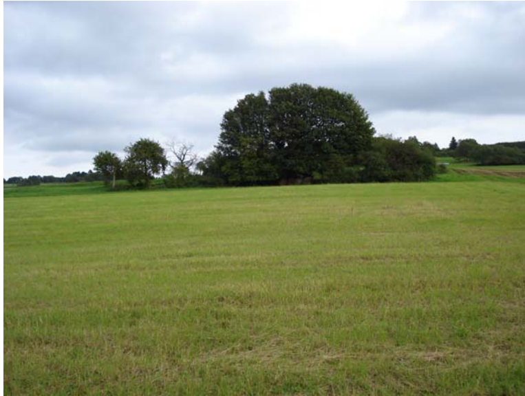
Abbildung 2: Ehemalige Ackerfläche südwestlich von Burkhardts (TK 5521/1, Anhang 1: Parzelle 22). Auf dem Acker wurde Notothylas orbicularis bereits 1980 von J. Futschig gefunden, er beherbergte noch 2004 eine der größten Kugel-Hornmoos-Populationen (und Anthoceros neesii -Vorkommen). Den Behörden ist es nicht gelungen, den Landwirt für eine Zusammenarbeit zu gewinnen. Nach 2004 wurde Mais angebaut oder aber der Acker sehr früh und gründlich bis zum äußersten Rand umgebrochen (wo die meisten Notothylas orbicularis -Pflanzen gefunden worden waren). 2010 wurde die Parzelle als Heuwiese genutzt, ebenso eine weitere benachbarte Notothylas orbicularis -Fläche. Eine dritte kleine Parzelle liegt seit mehreren Jahren brach.