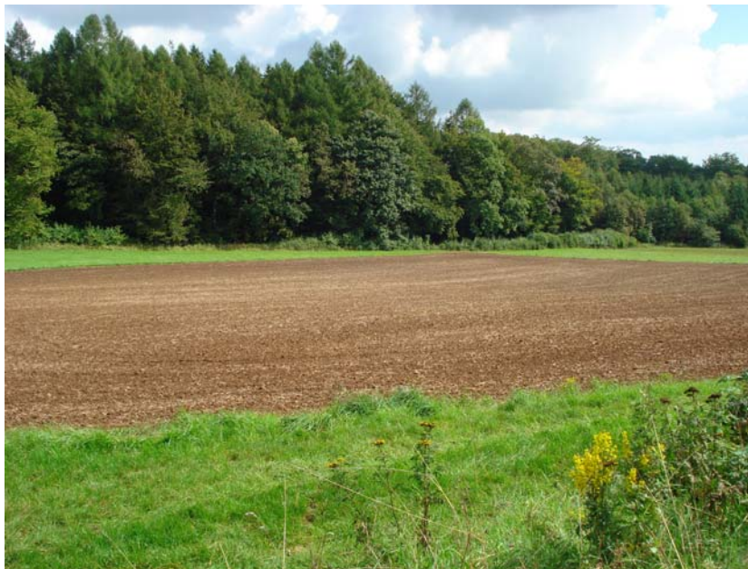
Abbildung 5: Acker am Atzküppel südlich von Wüstwillenroth (Anhang 1: Parzelle 32) mit größeren Notothylas orbicularis -Beständen. Die Parzelle lag mehrere Jahre noch bis spät in den Herbst hinein brach, wurde jedoch 2010 bereits im August umgebrochen.