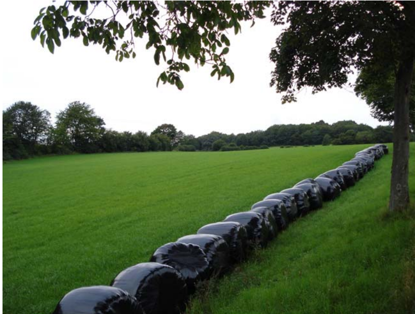
Abbildung 4: Ehemaliger Getreideacker südöstlich von Eschenrod/Schotten (Anhang 1: Parzelle 16). Die Parzelle beherbergte eines der reichsten Notothylas orbicularis -Vorkommen im Vogelsberg. Zuletzt konnte das Kugel-Hornmoos hier 2007 nachgewiesen werden. Seitdem wird die Fläche als Wiese genutzt.