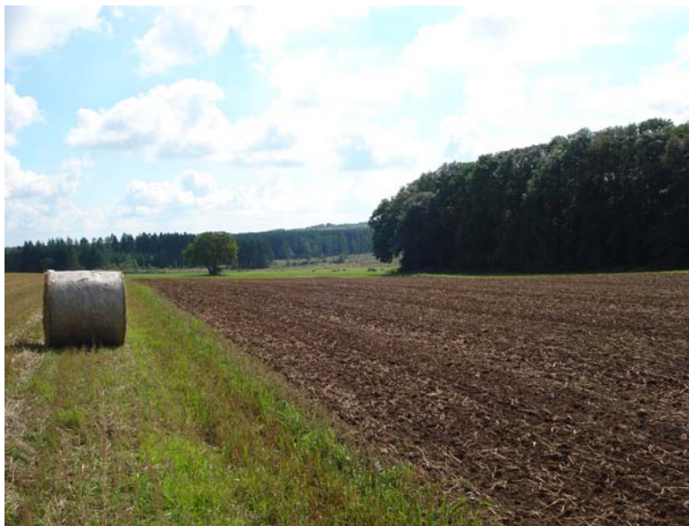
Abbildung 3: Umgebrochene Ackerparzelle südöstlich von Wüstwillenroth (Anhang 1: Parzelle 31). Die Notothylas orbicularis -Vorkommen wurden auf einer Exkursion der Bryologischen Arbeitsgemeinschaft im Herbst 2002 entdeckt (Weddeling 2002). Mehrere Jahre bestanden hier Pflegevereinbarungen mit dem Landwirt. 2010 wurde die Fläche bereits im August umgebrochen.