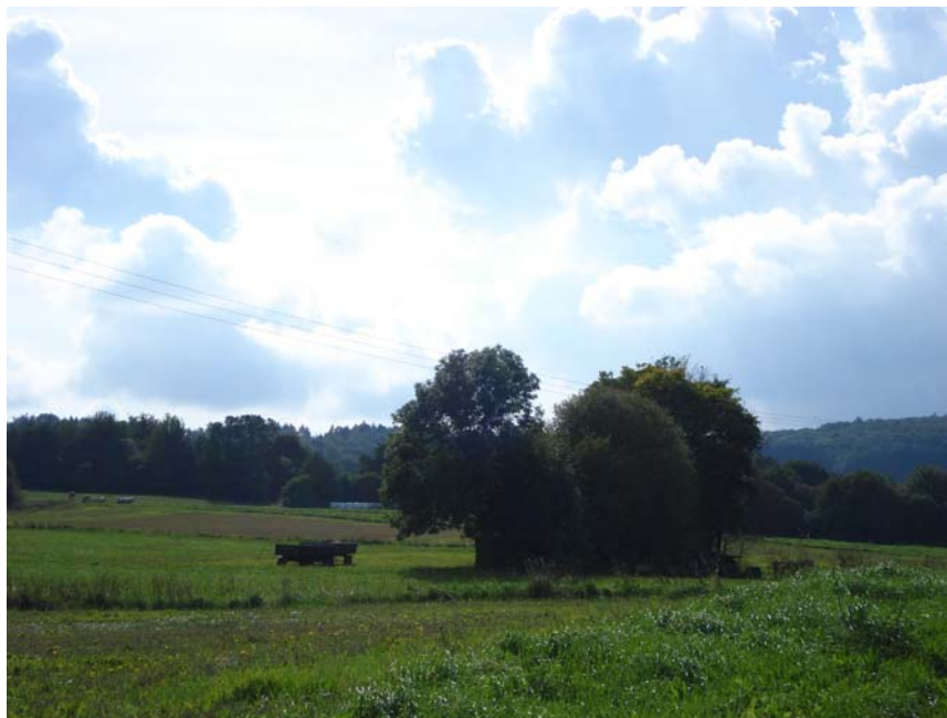
Abbildung 6: Agrarlandschaft südlich von Ilbeshausen-Hochwaldhausen, hier werden mehrere kleine Parzellen von Notothylas orbicularis besiedelt (TK 5421/4: Parzellen 9, 10, 11). Charakteristisch ist ein kleinflächiger Wechsel von Grünland und Ackerparzellen. Die Flächen werden wahrscheinlich nur noch im Nebenerwerb bewirtschaftet. Hier ist in absehbarer Zeit, wie auch für weitere Ackerflächen in den höheren Lagen des Vogelsberges, mit einer Aufgabe der ackerbaulichen Nutzung zu rechnen.