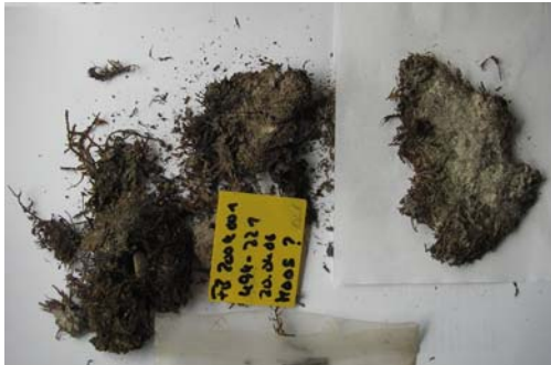
Abb. 1: Moosprobe aus Latrine