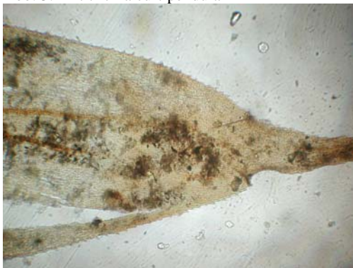
Abb. 5: Antitrichia curtipendula