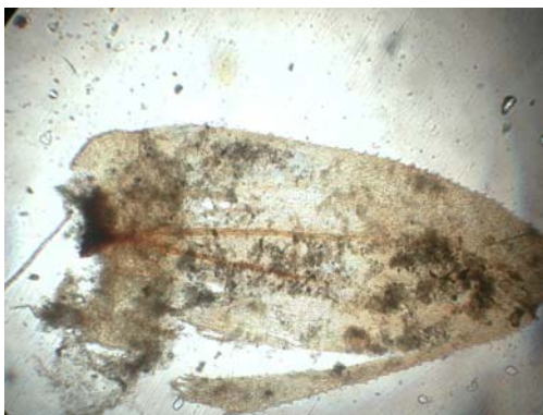
Abb. 3: Antitrichia curtipendula