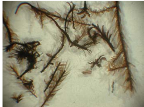
Abb. 2: Aufgeschwemmte Moose