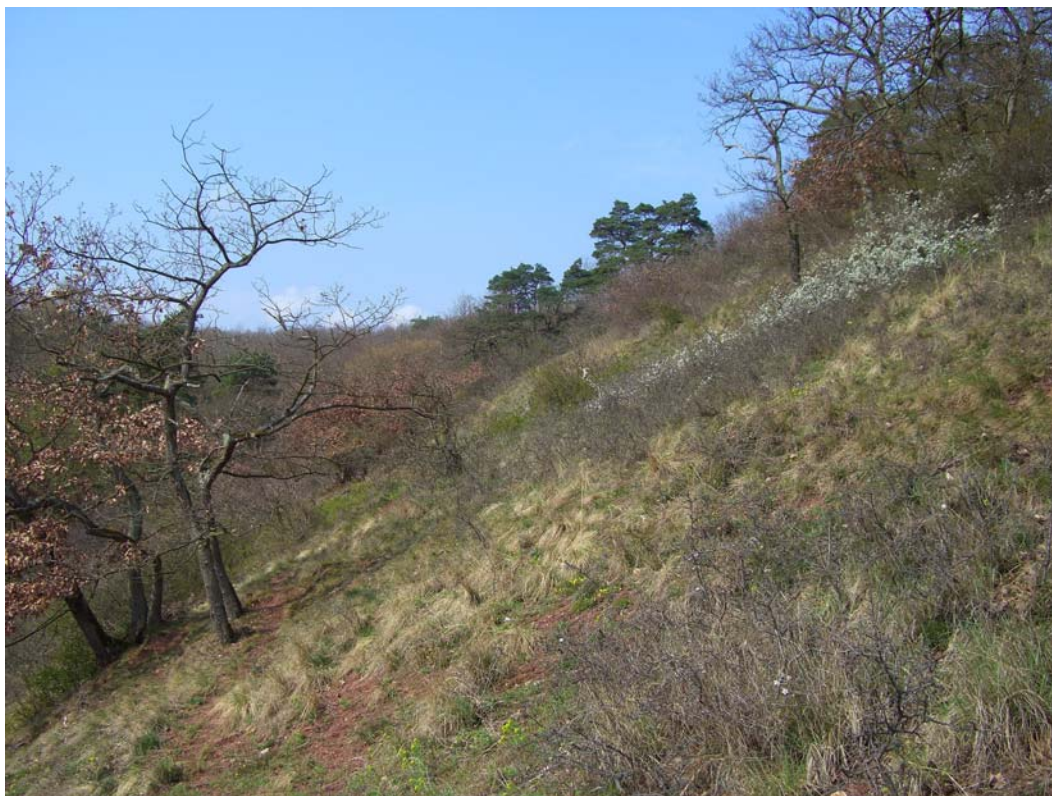
Abb. 2: Blick in den Felstrockenrasen des Teilgebietes „Fichtekopf“.