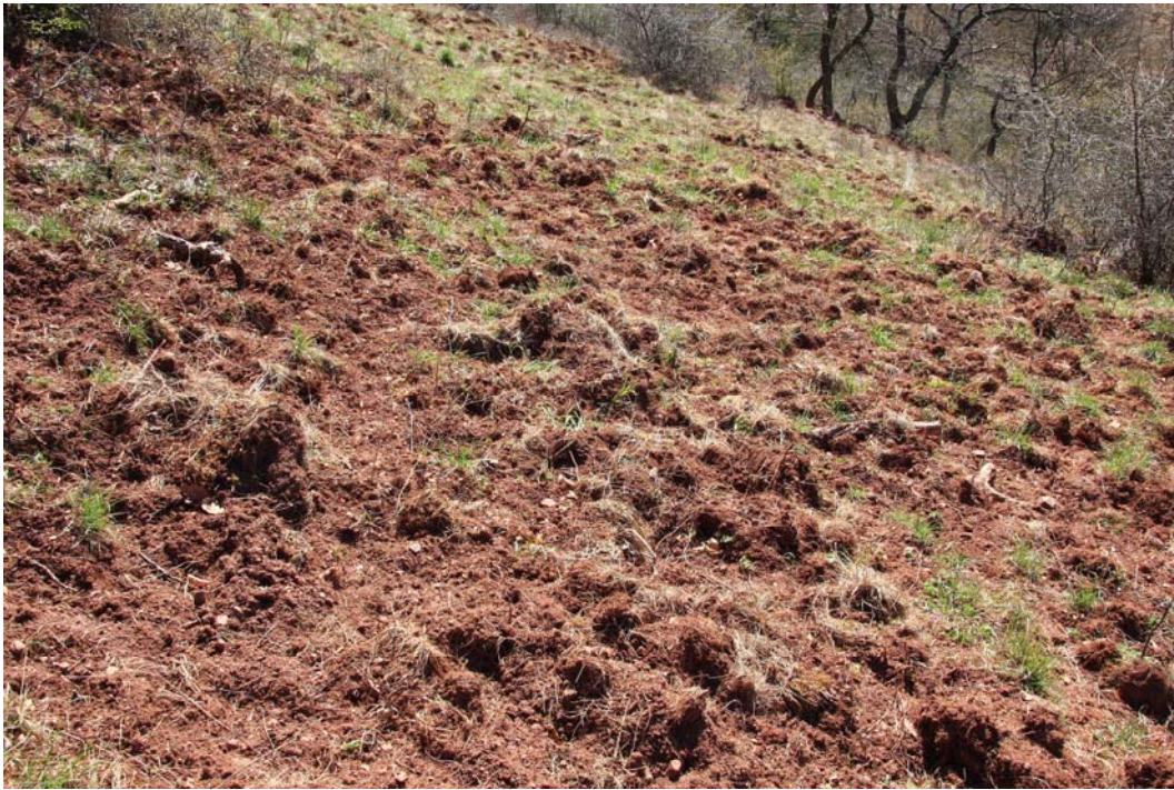
Abb. 5: In großen Teilen des Naturschutzgebietes Saukopf „pflügen“ Wildschweine die Felstrockenrasen regelmäßig um und zerstören damit Lebensstätten empfindlicher Moose.

Fichtekopf mit 21% etwas höher als im Saukopf (15%). Die meisten Moose fallen in die Kategorie V (zurückgehend) oder 3 (gefährdet). Einige sind auch vom Aussterben bedroht und nur in wenigen Exemplaren vorhanden ( Mannia fragrans , Pottia mutica , Seligeria donniana ). Eine Gefährdung droht vielen Moosen durch Sukzession und durch Auswirkungen eines hohen Wildbesatzes. Hierunter haben besonders gegen Störung empfindliche Arten zu leiden.