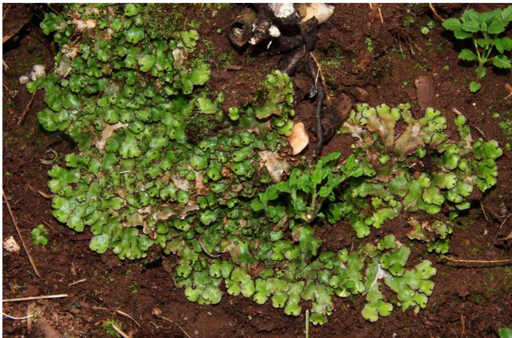
Abb. 3: Reboulia hemisphaerica im Felstrockenrasen des Teilgebietes „Saukopf“.