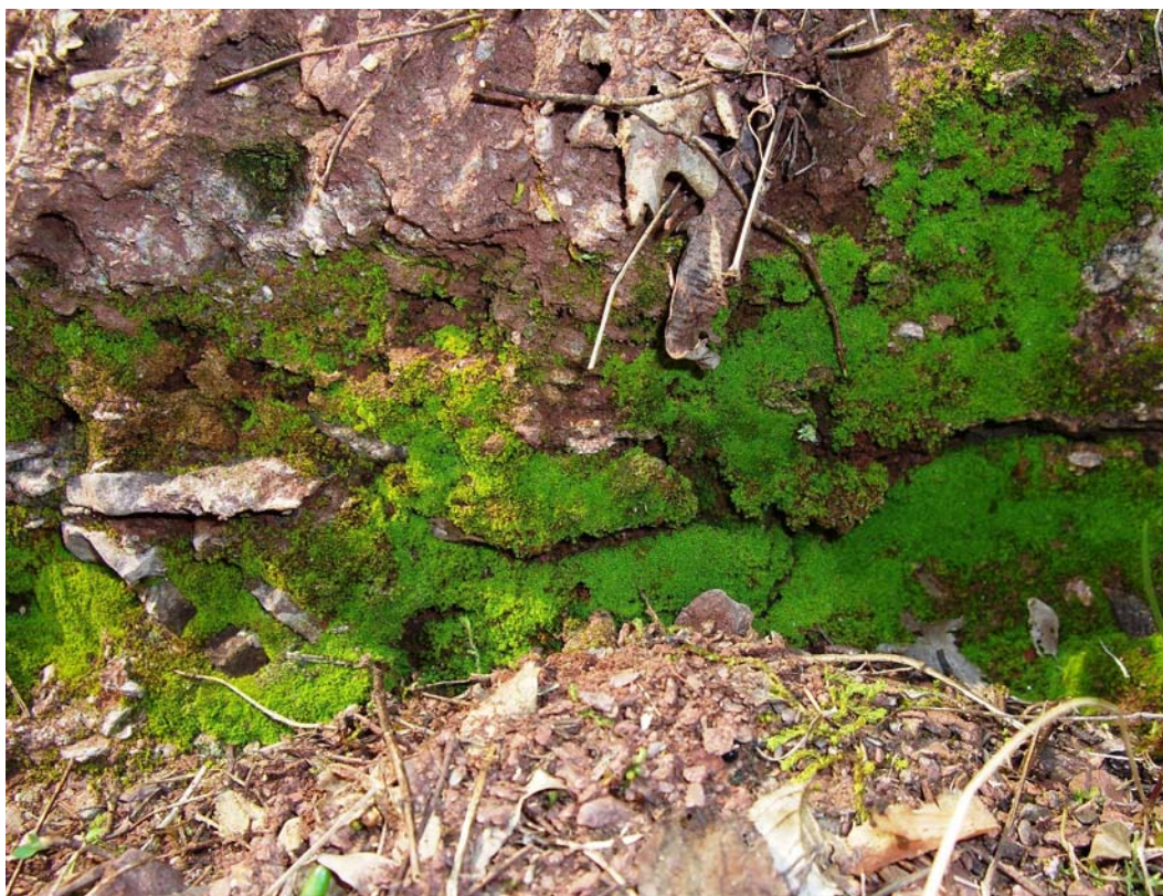
Abb. 4: Gymnostomum viridulum in einer beschatteten Felsnische im NSG Fichtekopf.