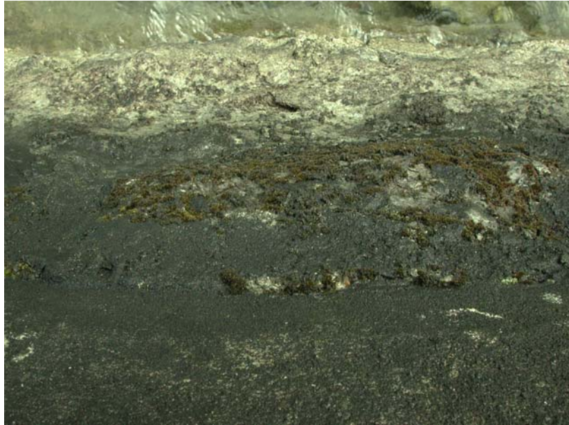
Abb. 4: Blick auf Hyophila von der Ufermauer.