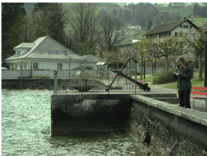
Abb. 1: Standort von Hyophila involuta am Vierwaldstättersee in Hergiswil. Die Art wächst im Spritzbereich der Ufermauer.

Philippi, G. 1968. Zur Verbreitung einiger hygrophytischer und hygrophiler Moose im Rheingebiet zwischen Bodensee und Mainz. Beitr. Naturk. Forsch. SW-Deutschland XXVII: 61-81.