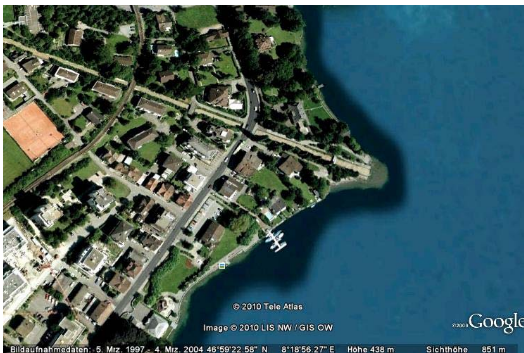
Abb. 3: Lage des Hyophila-Standortes (blaues Quadrat am Seeufer im unteren Teil des Luftbildes).