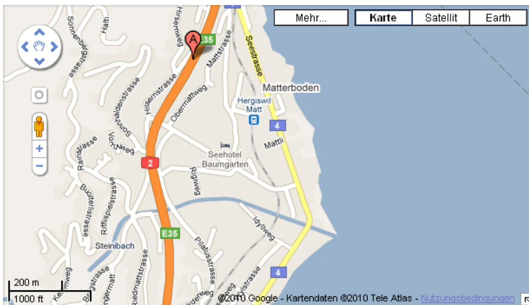
Abb. 2: Karte von Hergiswil. Autobahnabfahrt am Oberen Kartenrand, Hyophila-Standort am unteren