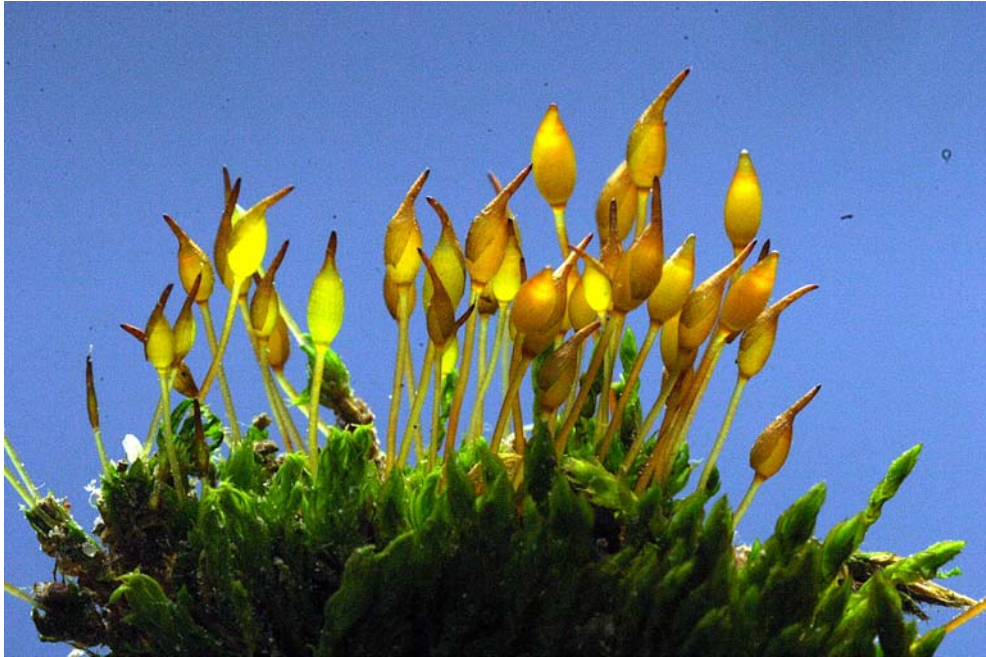
Abb. 3: Pottia bryoides mit langen Seten. Die Pflanzen ähneln P. intermedia , zeigen im Gegenlicht aber cleistocarpe Kapseln mit kurzen, stumpfen und nicht geschälbelten Kapseldeckeln.