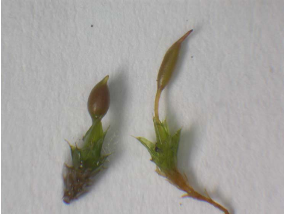
Abb. 5: Pottia bryoides typisch (links) und Form mit langer Seta und zylindrischer Kapsel (rechts).