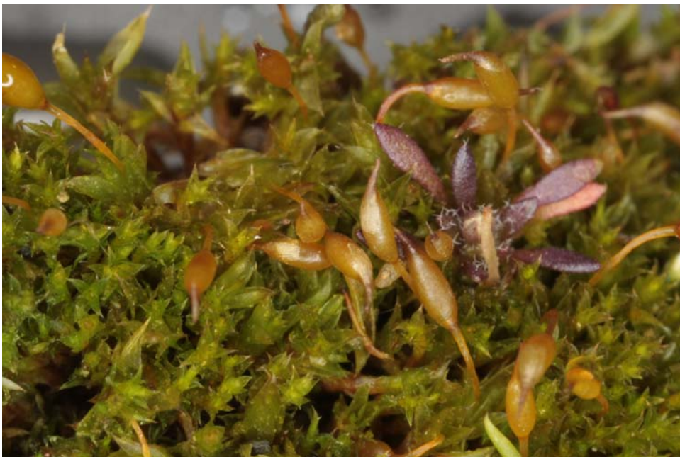
Abb. 6: Pottia bryoides mit langen Seten und zylindrischen cleistocarpen Kapseln.