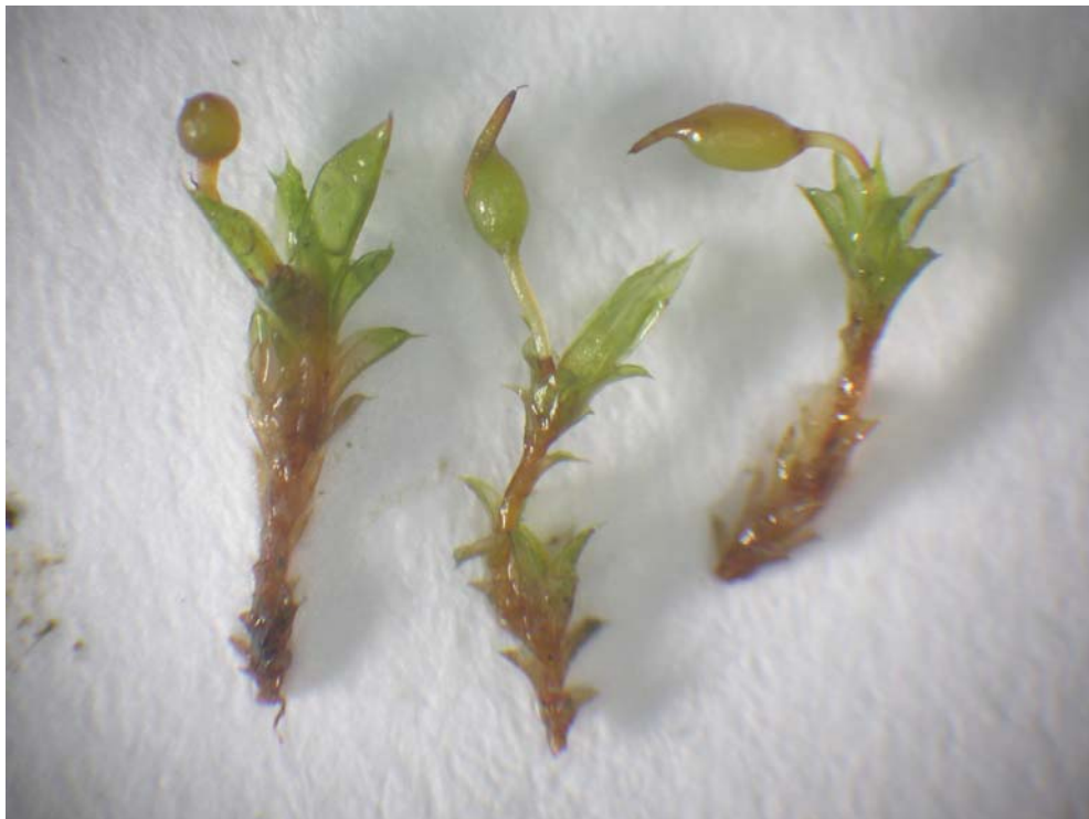
Abb. 4: Pottia bryoides Pflanzen aus demselben Rasen mit runder Kapsel, normaler eiförmiger Kapsel und gerader Seta und normaler Kapsel mit gebogener Seta.