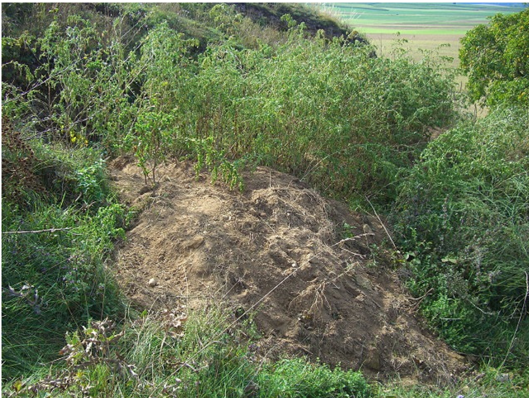
Abb. 5: Anhäufungen von Sand bestanden mit nitrophilen Chenopodium - und Atriplex -Arten bedecken als Folge der Wühltätigkeit von Kaninchen botanisch wertvolle Trockenrasen.

Eine hohe Gefährdung der Sandrasenarten besteht im starken Besatz des Gebietes mit Kaninchen ( Oryctolagus cuniculus ). Diese Tiere finden in den Sanden unter und zwischen den Felsen ideale Lebensbedingungen und haben mit dem Auswurf ihrer Bauten bereits einen Teil der Trockenrasen zerstört (Abb. 5). Die ständig abgesetzte Losung dieser Tiere führt außerdem zu einer sichtbaren Eutrophierung. Eine Verringerung des Tierbestandes erscheint eine der wichtigsten Artenschutzmaßnahmen zu sein. Daneben ist die Entfernung in das Gebiet vordringender Gehölze wie Crataegus monogyna und Prunus spinosa von existenzieller Bedeutung.