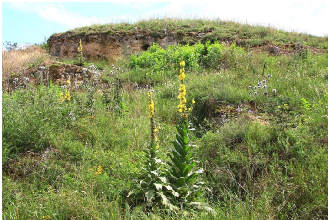
Abb. 2: Blick in den Trockenrasen mit einer Felsrippe südlich Eckelsheim.