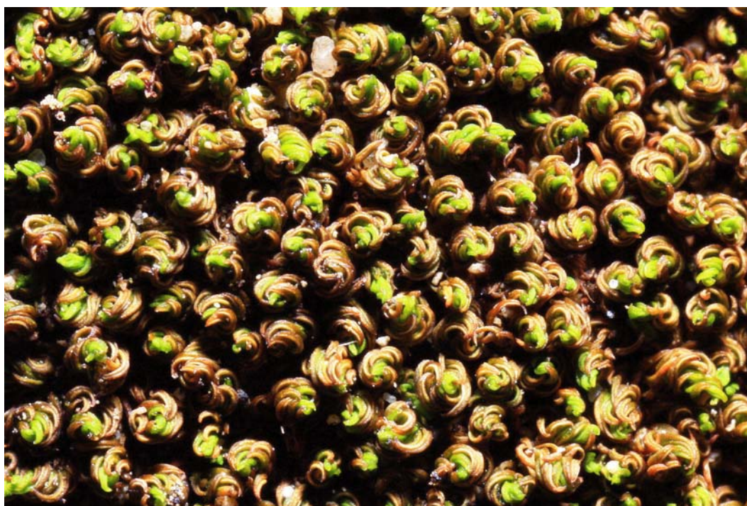
Abb. 3: Pseudocrossidium revolutum auf Sandstein bei Eckelsheim.

Unter den restlichen Arten sind temperate weitaus in der Mehrzahl. Die außerdem auftretenden subborealen oder subozeanischen Arten sind nur jeweils zweimal vorhanden. Auffallend an dieser Gruppe ist ferner die geringe Anzahl an gefährdeten Arten (Tab. 3).