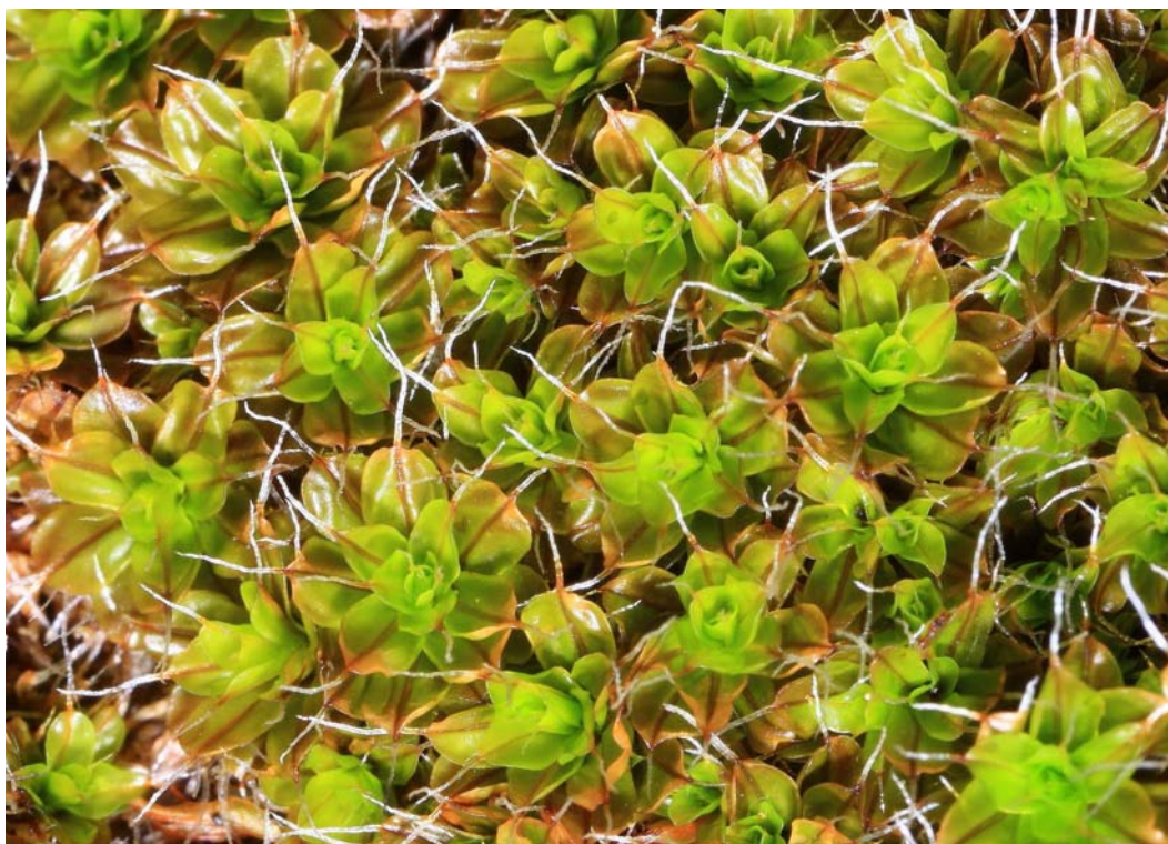
Abb. 3: Die submediterrane Tortula crinita im Felstrockenrasen südlich von Eckelsheim.

Die Untersuchung der Felsen und der angrenzenden Sand-Trockenrasen ergab insgesamt 40 Arten. Die vier von CASPARI (2004) für diese Lokalität genannten Taxa konnten im Rahmen der vorliegenden Erhebungen mit Ausnahme von Phascum cuspidatum var. piliferum bestätigt werden. Eine Differenzierung der Arten nach Arealtypen zeigt, dass auf den südexponierten und extrem trockenen Fels- und Sandfluren submediterrane Arten dominieren (35%). Wie aus der folgenden Aufstellung hervorgeht (Tab. 2), ist der hohe Anteil an Rote-Liste-Arten dieser Gruppe beachtlich (71%).